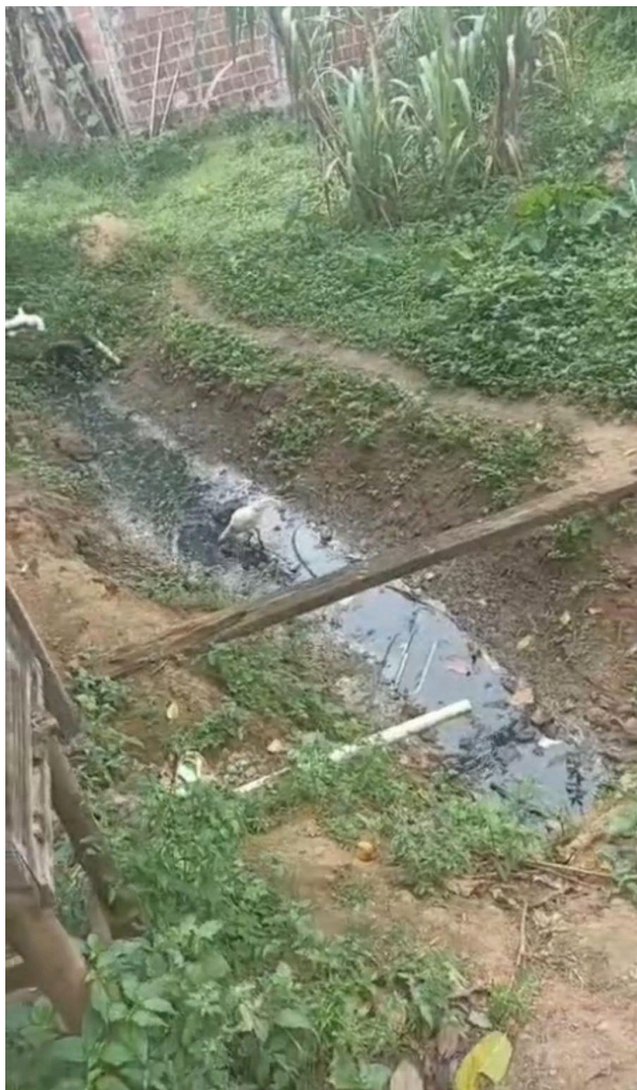
Foto enviada por moradora da Rua Professora Jardelina, mostrando o esgoto a céu aberto.