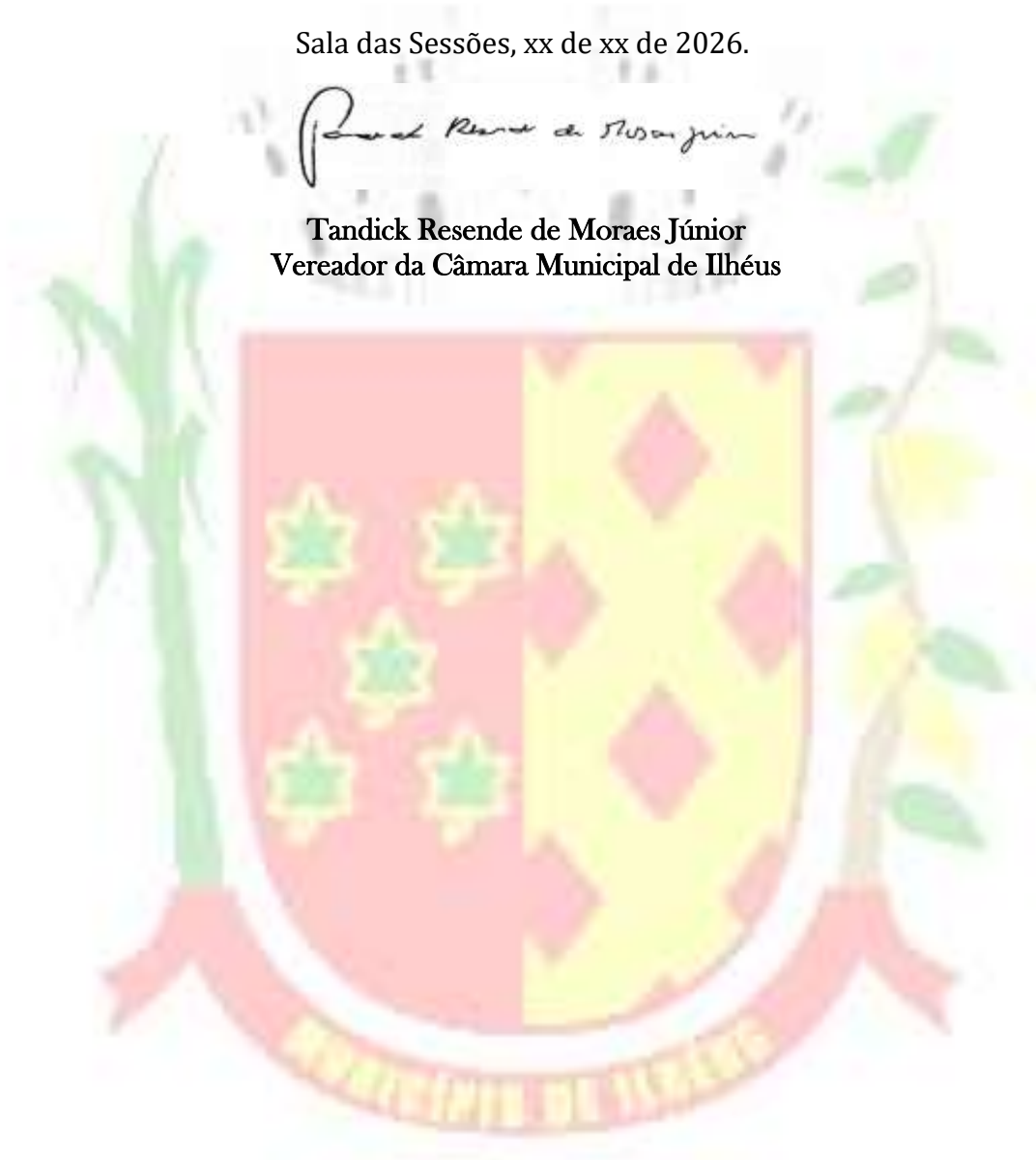
Tandick Resende de Moraes Júnior Vereador da Câmara Municipal de Ilhéus